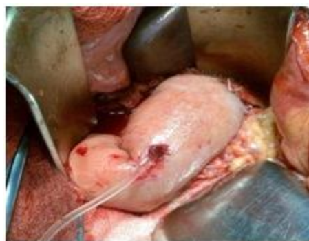
Рис. 6. Интраоперационное фото. Формирован ПДА и конец катетера выведен через отверстие в кишке

Затем на стенке отключенной петли тощей кишки (у места планируемой подвешной микроэнтеростомии) проводится прокол и через него выводятся концы «каркасных» дренажей (рис. 7).