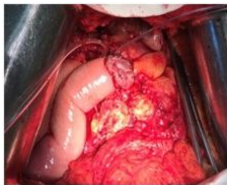
Рис. 5. Интраоперационное фото. Момент формирования задней губы ПДА

Дальнейший этап заключается в формировании ПДА «конец в конец» на «каркасном» дренаже (рис. 5, 6).