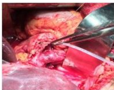
Рис. 2. Интраоперационное фото ПЖ. В проток ПЖ введен силиконовый катетер

После завершения мобилизационно-резекционного этапа ГПДР в проток ПЖ вводится силиконовый катетер соответствующего диаметра с перфорированным рабочим концом (рис. 2) и, отступя от края среза ПЖ на 0,5–1,0 см, накладывается кисетный шов (рис. 3).