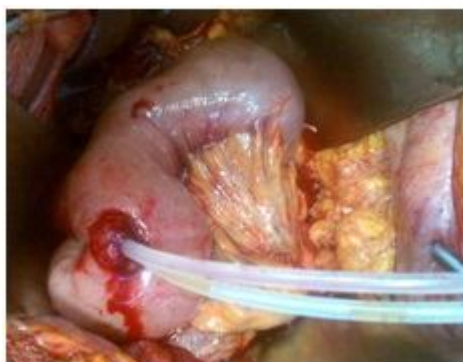
Рис. 7. Интраоперационное фото. Концы «каркасных» дренажей выведены через прокол отключенной петли тощей кишки

Затем на стенке отключенной петли тощей кишки (у места планируемой подвешной микроэнтеростомии) проводится прокол и через него выводятся концы «каркасных» дренажей (рис. 7).