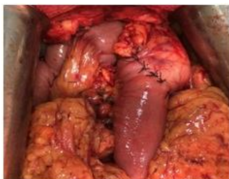
Рис. 12. Интраоперационное фото. Завершенный вариант ГЭА

ГЭА формируется на единой петле позади ободочной кишки (рис. 12).