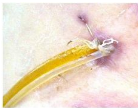
Рис. 11. Интраоперационное фото. Концы «каркасных» дренажей выведены на брюшную стенку

ГЭА формируется на единой петле позади ободочной кишки (рис. 12).