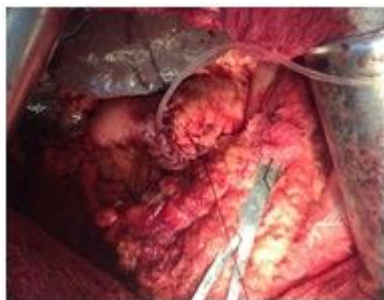
Рис. 3. Интраоперационное фото. На культю наложен кисетный шов