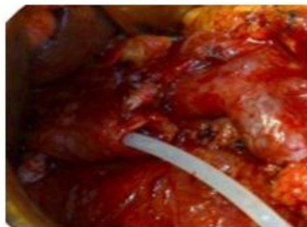
Рис. 4. Интраоперационное фото. В гепатикохоledох введен силиконовый катетер

Далее в желчный проток также вводится силиконовый катетер, который фиксируется к краю среза протока (рис. 4).