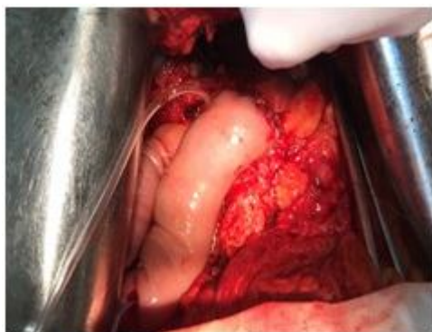
Рис. 8. Интраоперационное фото. Момент формирования задней губы БДА