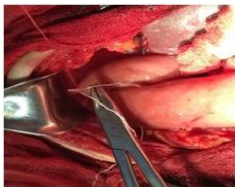
Рис. 10. Интраоперационное фото. Момент подшивания стенки кишки к париетальной брюшине

Отверстие в стенке кишки вокруг «каркасных» дренажей суживают путем наложения кисетного шва викриловыми нитями, концы которых выводятся на брюшную стенку. Кишка вокруг дренажей подшивается к париетальной брюшине узловыми швами (рис. 10, 11).